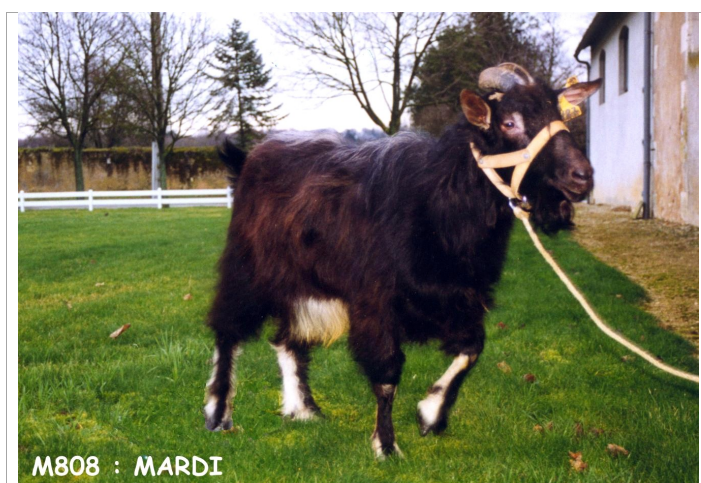
M808 : MARDI