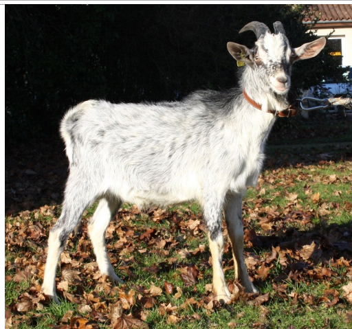
Financement CRB Anim