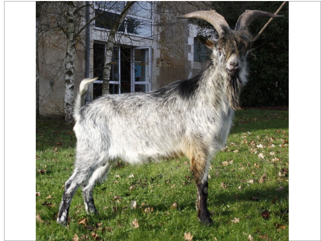
Financement CRB Anim