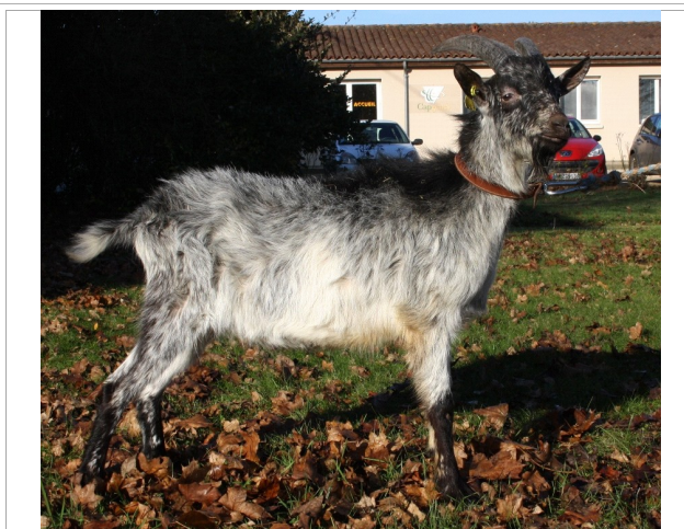
Financement CRB Anim