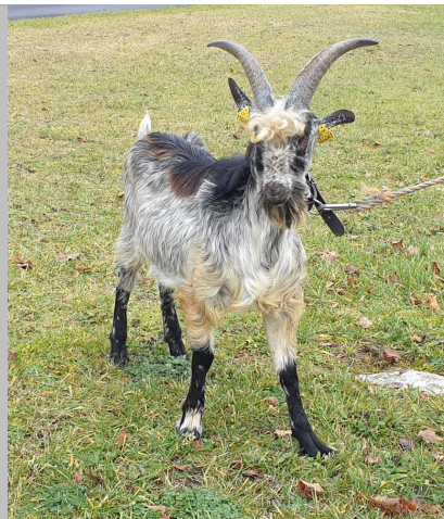
Financement CRB Anim