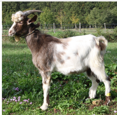
Financement CRB Anim