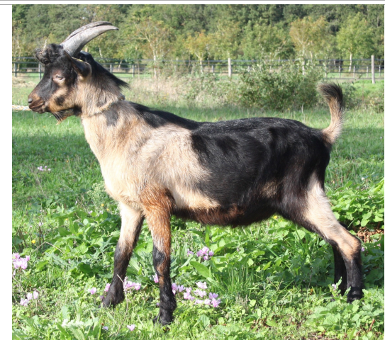
Financement CRB Anim