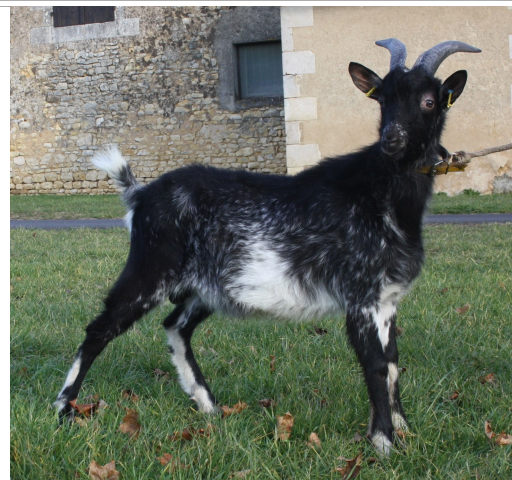
Financement CRB Anim