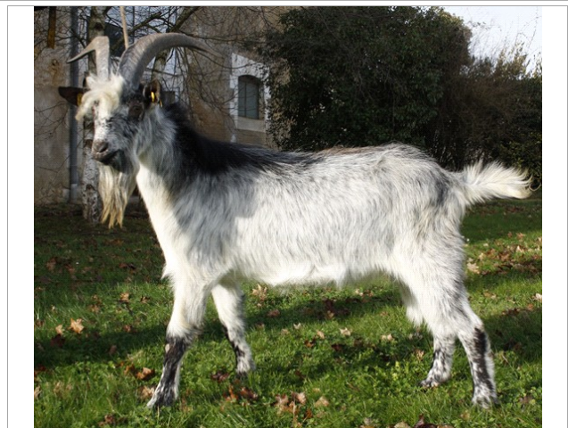
Financement CRB Anim