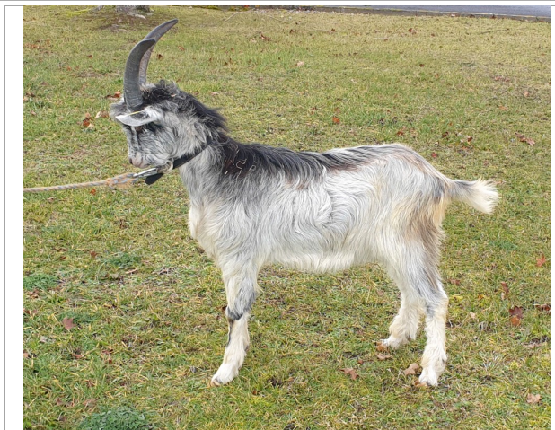
Financement CRB Anim