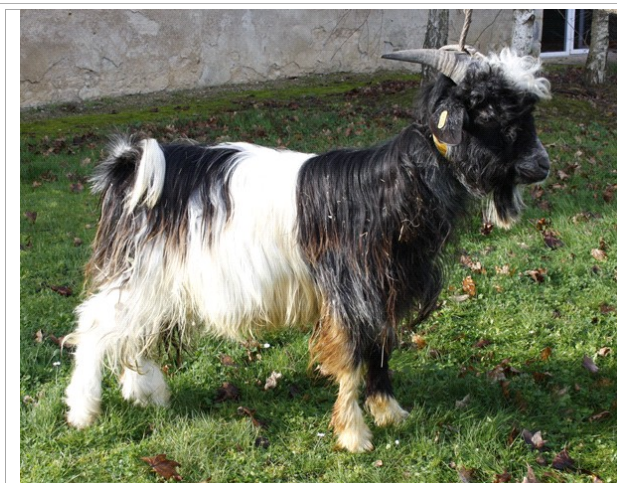
Financement CRB Anim