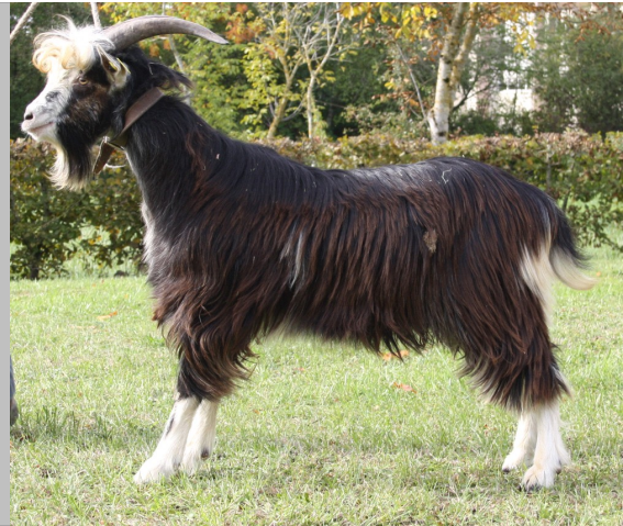
Financement CRB Anim