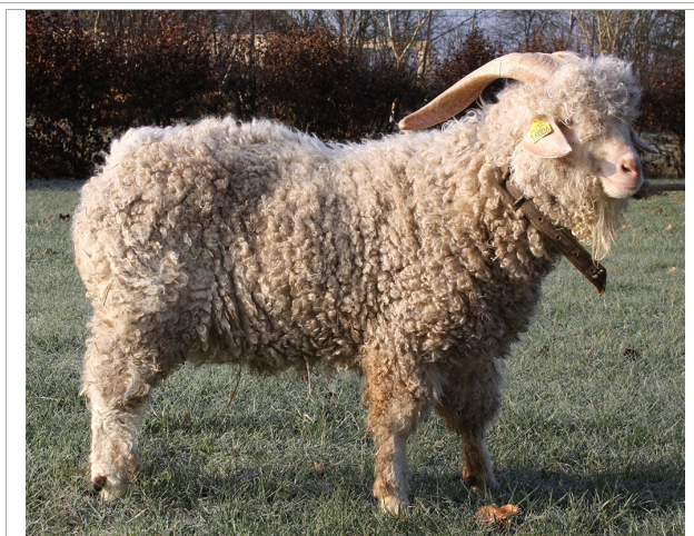
Financement CRB Anim