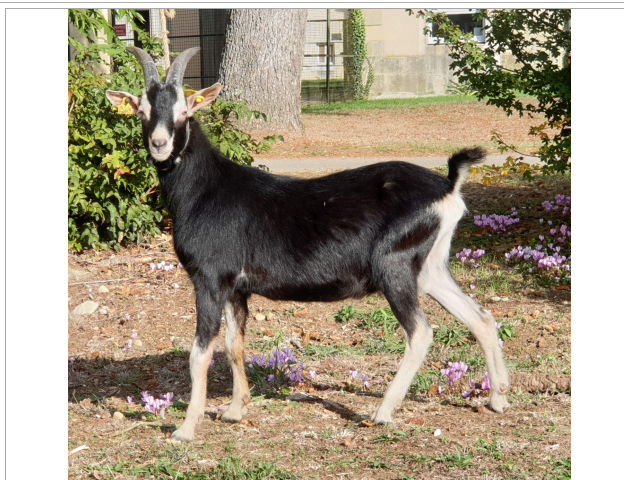
Financement CRB Anim