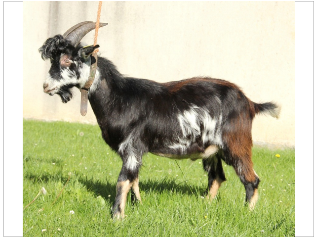
Financement CRB Anim