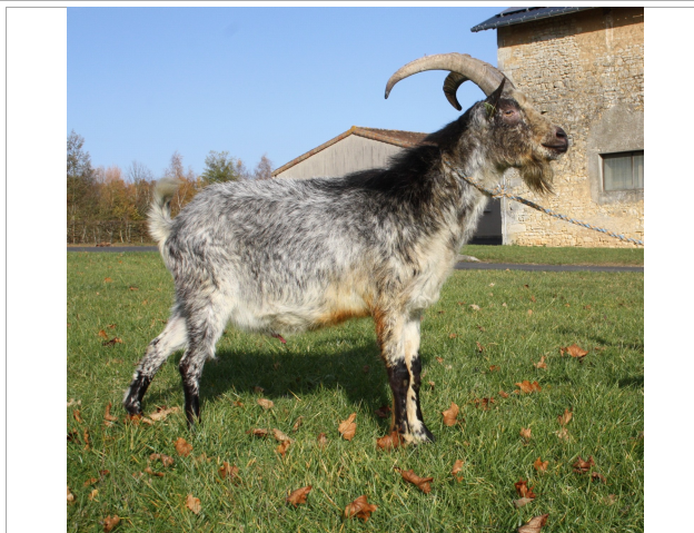
Financement CRB Anim