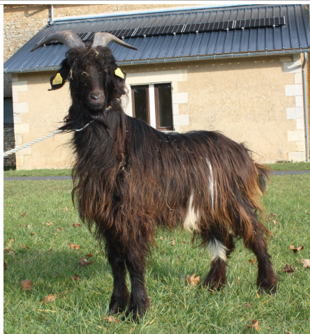
Financement CRB Anim