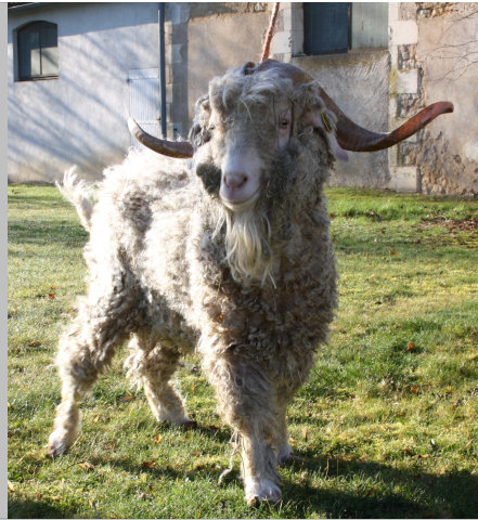
Financement CRB Anim