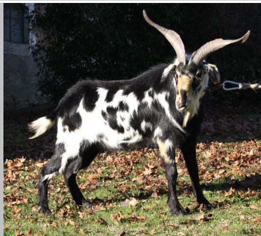
Financement CRB Anim