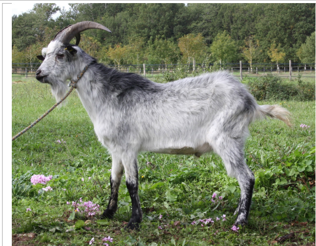
Financement CRB Anim