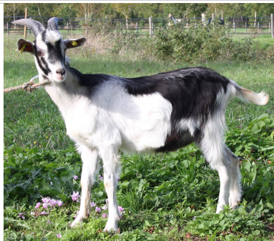
Financement CRB Anim