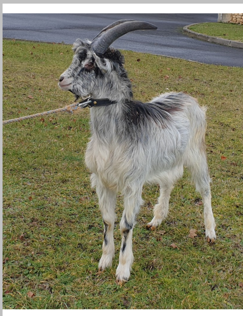
Le bouc SIGMUND S870 Race Lorraine